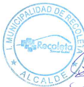
DANIEL JADUE JADUE ALCALDE